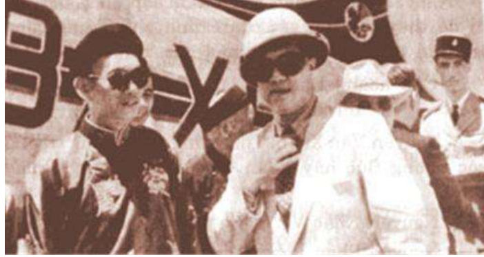
Phan Văn Giáo & Bảo Đại ở phi trường Đà Lạt 1949

Bảo Đại mời một số chính khách lên biệt điện Đà Lạt để bàn thảo về việc chọn một Tham Mưu Trưởng cho QĐ/QG/VN. Trong các nhân vật được quốc trưởng đề cử, có tên Bảy Viễn. Thủ hiến Trung phần, dượng sĩ Phan Văn Giáo, là người đã kích Bảy Viễn hơn ai hết. Không may cho ông, là ông chê bai Bảy Viễn trước mặt đại diện Lai Hữu Sang. Tư Sang điện khẩn vụ việc, báo cáo cho Bảy Viễn.