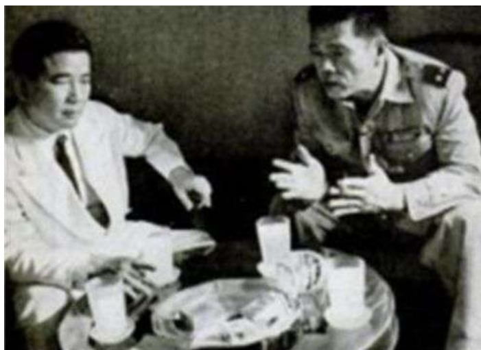
TT Diệm cùng tướng Bảy Viễn