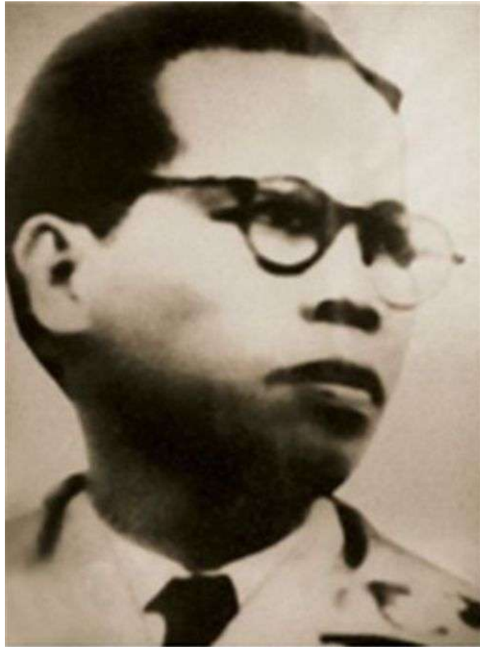
Tướng Nguyễn Bình

Khi Ba Dương bị Tây bắn chết, được VM phong chức thiếu tướng đầu tiên ở miền Nam. Bảy Viễn có tham vọng muốn lên thay Ba Dương làm chỉ huy trưởng, nhưng bị cán bộ VM ngăn chặn, nên không thành. Lãnh đạo kháng chiến Nam Bộ là Thiếu tướng Nguyễn Bình, tên thật là Nguyễn Phương Thảo, em kết nghĩa với tướng cướp, nhà văn Sơn Vương Trương Văn Thoại. Nguyễn Bình, một mặt muốn giữ lực lượng của Bảy Viễn theo VM, một mặt tách rời Bảy Viễn ra khỏi quyền lực, bằng cách phong chức Tư lệnh phó khu 7 cho Bảy Viễn.