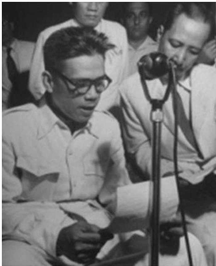
Bảy Viễn Tướng Bình Xuyên

- Năm 1936. Ngày 28/8/1936, bị kết án 12 năm khổ sai, đày đi Côn Đảo về tội cướp tiệm vàng ở Giồng Ông Tố, thu được số tiền rất lớn là 6,000$. (Hồi đó, 1 đồng bạc mua được 5 giạ gạo).