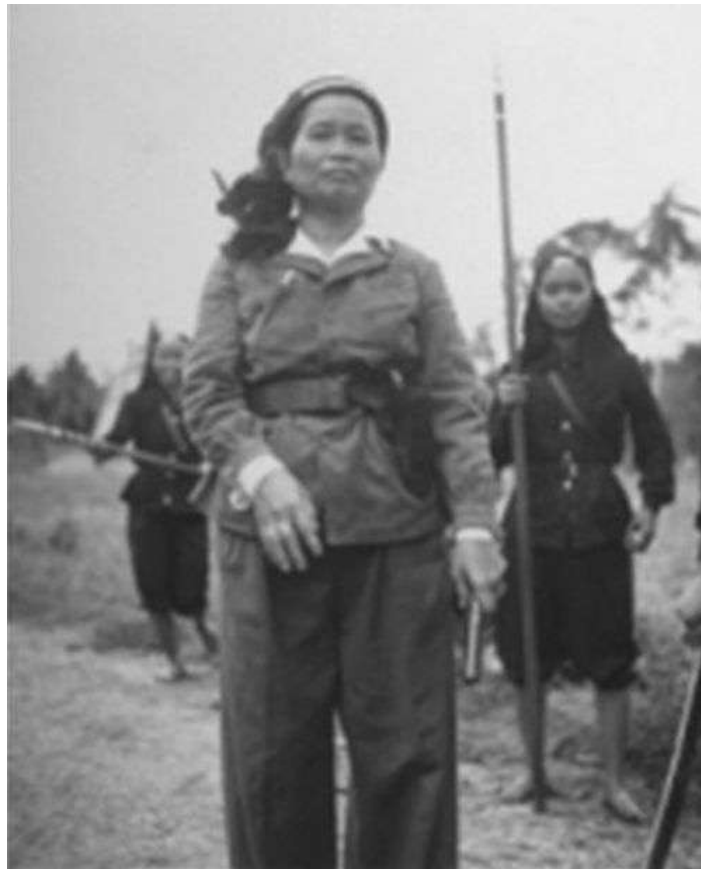
Nữ quân Bình Xuyên

Ngày 5/10/1945, tướng Pháp Leclerc đến Tân Sơn Nhất, sau khi chiến hạm Triomphant chở đầy lính cập bến Sài Gòn. Tướng Leclerc tuyên bố, Pháp sẽ quét sạch Việt Minh trong 3 tuần lễ. Quân Pháp bắt đầu đánh chiếm Biên Hòa, Thủ Dầu Một, Tân An, Mỹ Tho. Ủy viên quân sự Trần Văn Giàu cho các đơn vị vũ trang rút ra ngoại ô, tổ chức đánh du kích. Thực dân Pháp bắt đầu chiến dịch truy tìm những thành phần theo Việt Minh và những nhóm anh chị giang hồ, đầu trộm đuôi cướp, vì thế, Bảy Viễn phải ra bưng.