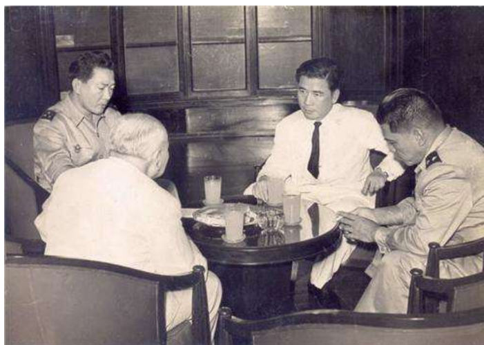
Ba Tướng đối lập với ông Ngô Đình Diệm : Nguyễn Văn Xuân, Nguyễn Văn Hinh, và Lê Văn Viễn (thủ lĩnh Bình Xuyên) đang diễn mua chuộc HHHG tại Dinh Độc Lập

Quân đội Pháp ngày càng thua trên các mặt trận, Bảo Đại qua Pháp, gọi là để theo dõi thời cuộc, cho rằng số phận VN sẽ được giải quyết tại bàn hội nghị giữa các cường quốc. Hoa Kỳ thuyết phục Bảo Đại chấp thuận cho Ngô Đình Diệm làm thủ tướng. Bảo Đại không ưa gì ông Diệm, nhưng tình thế bắt buộc nên phải đồng ý.