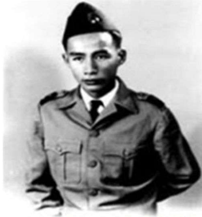
Trung Tướng Trịnh Minh Thế 1922 - 1955