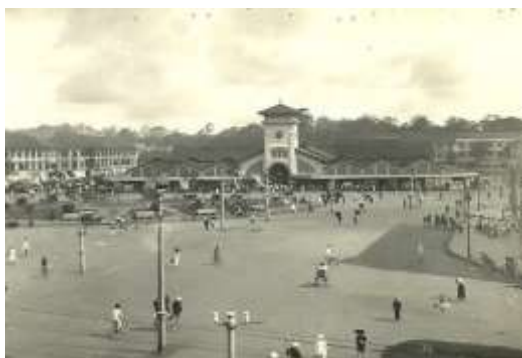
Chợ Bến Thành 1920 – 1930.

Chợ Bến Thành đã trải qua vài lần trùng tu, lần mới nhất là năm 1985. Tuy chợ không còn nét đẹp trầm lắng như trăm năm trước nhưng vẫn là biểu tượng của thành phố Sài Gòn.