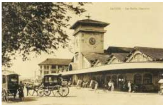
Xe ngựa bốn bánh – phương tiện đi lại của người giàu ở Sài Gòn thuộc địa – trước Chợ Bến Thành năm 1921.