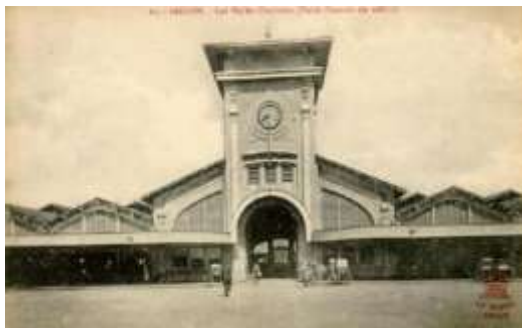
Chợ Bến Thành năm 1914 khi mới làm lễ khai thị