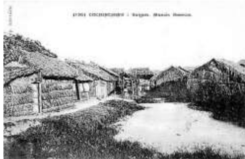
Ao Bò Rệt (Marais Borese) ngày xưa, tức vị trí chợ Bến Thành ngày nay.

Địa điểm được chọn chính là khu chợ Bến Thành ngày nay. Thời đấy đó là một cái ao sình lầy gọi là ao Bò Rệt (Marais Borese) chen chúc nhà cửa lợp tranh tre tạm bợ. Chiếc ao này được lấp đi, chợ được xây với bốn cửa lớn nhìn ra 4 mặt đường.