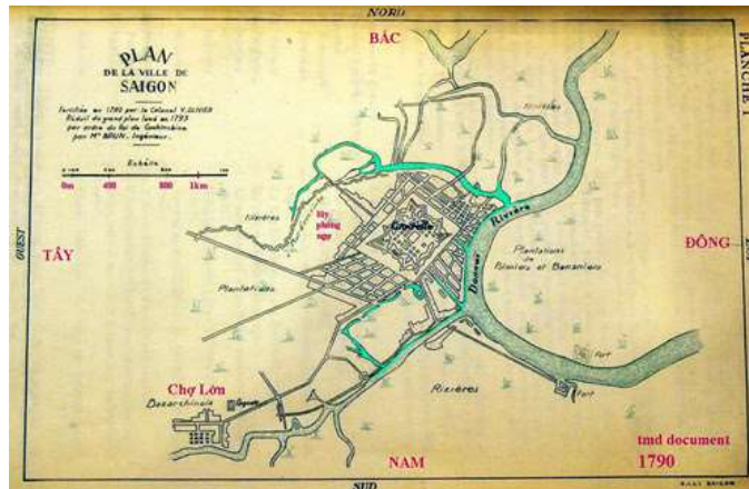
Bản đồ Sài Gòn năm 1790 do người Pháp vẽ, ở chính giữa là thành Bát Quái.

Thành Bát Quái khiến tuyến phòng thủ Nam Bộ trở nên vô cùng chắc chắn, quân Tây Sơn không sao đánh vào được. Nó có thể chống chọi được cả đạn pháo hiện đại nhất vào thời bấy giờ.