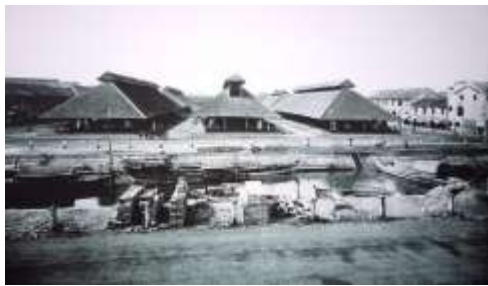
Chợ Bến Thành khi còn trên kênh Charner, đường Nguyễn Huệ ngày nay.

Tháng 2/1859, Pháp đánh chiếm thành Gia Định, các binh lính người Việt chống Pháp đã cho thiêu hủy chợ Bến Thành để thông thoáng cho tàu ghe lưu thông trên sông Sài Gòn.