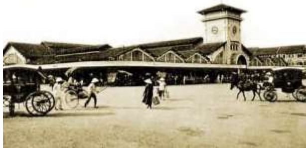
Chợ Bến Thành lúc mới xây xong tháng 3/1914, chưa làm lễ khai thị.

Chợ được hãng thầu Brossard et Maupin khởi công xây dựng từ năm 1912, đến năm 1914 thì xây xong. Chợ rộng 13.000m 2 với nền đất đá ong. Lễ khai thị (tức khai trương) diễn ra trong 3 ngày 28, 29 và 30/3/1914 với rất nhiều lễ hội văn hóa ẩm thực cùng các gian hàng, thu hút 100.000 người Sài Gòn và các tỉnh lân cận đến vui chơi.