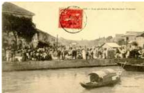
Một cảnh mua bán ở chợ Bến Thành khi còn ở kênh Charner.

Để có nơi buôn bán, năm 1860 người Pháp đã cho dời chợ vào trong, xây mới tại con kênh gọi là Kinh Lớn (sau này lấp lại thành đường Nguyễn Huệ), dọc bờ kênh này là đường Charner nên con kênh này còn được gọi là kênh Charner. Việc xây chợ tại con kênh này giúp ghe thuyền buôn bán hàng hoá lưu thông dễ dàng. Do chợ Bến Thành nằm ở vị trí giao điểm của khu đô thị và hợp lưu của hai tuyến đường thủy là kênh Lớn và rạch Cầu Sáu (nay là đường Hàm Nghi) nên luôn nhộn nhịp đông đúc, các cửa hiệu phần nhiều là của người Hoa, người Ấn Độ và người Pháp.