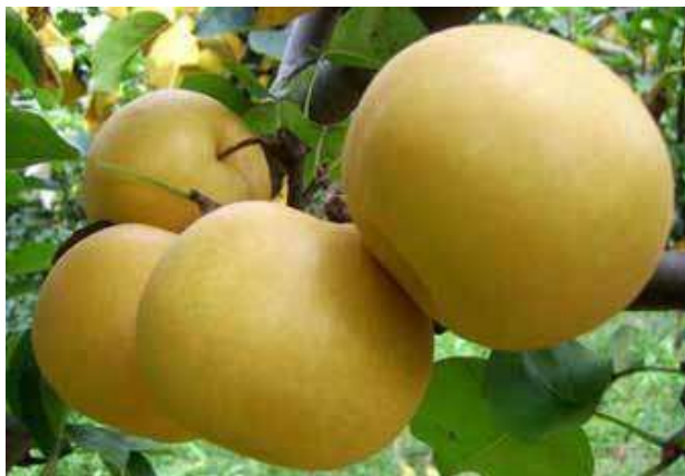
Loại táo có màu thâm nâu được cho là có xuất xứ Hàn Quốc.