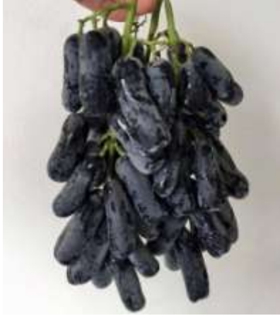
Nho ngón tay mới được du nhập vào nước ta thời gian gần đây.