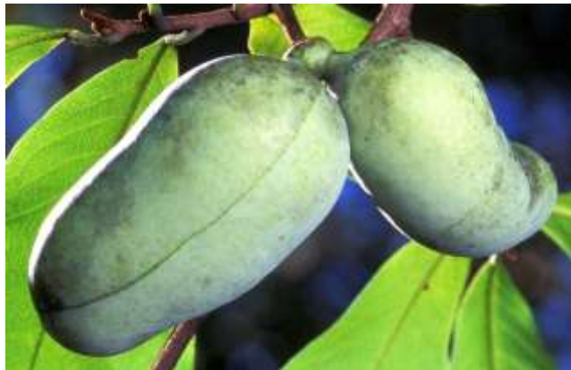
Chuối Paw Paw là một giống chuối phổ biến ở miền đông nam nước Mỹ. Thoạt nhìn, nó khá giống quả xoài, tuy nhiên quả này lại có giống chuối. Khi chín, quả có mùi thơm.