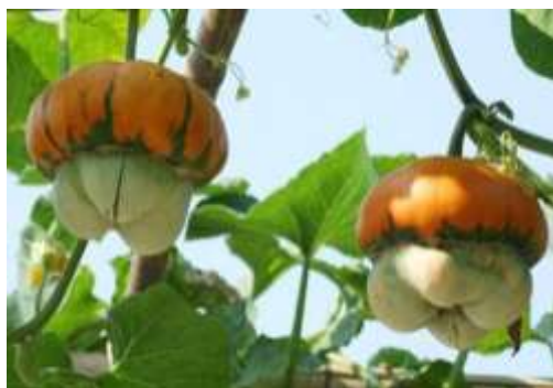
Bí đội nón là loại quả thực phẩm xuất xứ từ Nga mới du nhập vào.