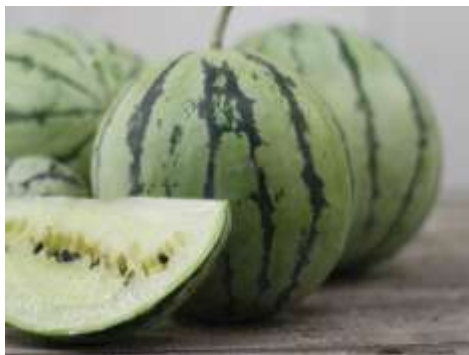
Dưa hấu ruột trắng. Giống dưa hấu rất lạ mắt vì có ruột màu trắng, vị dưa leo; cân nặng trung bình từ 2-5kg/quả; vỏ màu xanh, mỏng, rất dễ bị nứt trong quá trình vận chuyển.