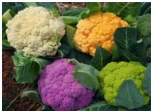
Súp lơ nhiều màu. Màu trắng nguyên thủy của nó được nhân tạo thành các màu xanh, tím và vàng. Việc thụ phấn làm biến đổi màu sắc và thành phần dinh dưỡng của súp lơ tím và vàng được tạo ra bởi một người dân mang tên Andrew Burgess tại thành phố Peterboroug ở Anh.