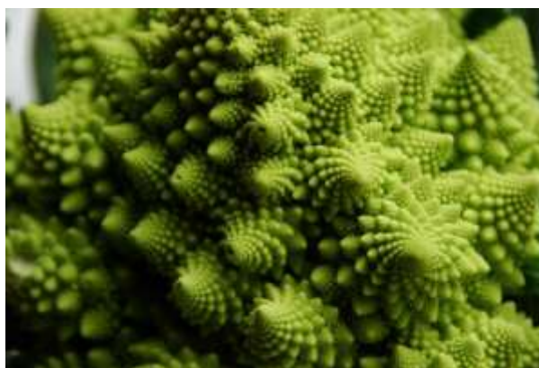
Bông cải Romanesco được đặt tên theo hình dáng kỳ lạ, kết hợp giữa bông cải và súp lơ xanh.