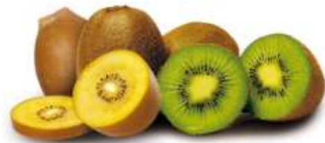
Kiwi biến đổi gen