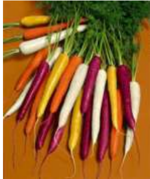
Cà rốt 7 sắc cầu vồng có đủ các màu trắng, vàng, cam, tím...