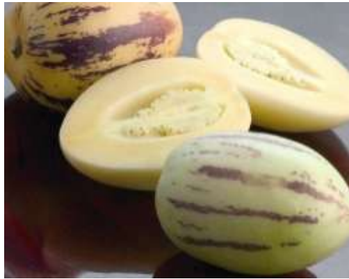
Quả dưa hấu Nam Mỹ có mùi thơm thanh mát, là nguyên liệu làm món tráng miệng.