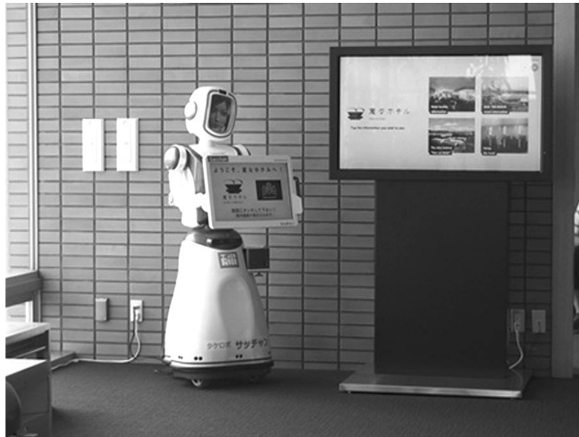
Robot “làm cảnh”

Chu-ri-chan là một linh vật dễ thương mang lại may mắn thường có ở các công viên giải trí, nhưng