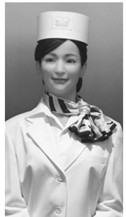
Actroid: robot biết cười

Muratec phát triển này vẫn đang trong thời gian thử nghiệm, sau khi hoàn thiện, nó sẽ đảm nhiệm vai trò của người phục vụ phòng. Bạn có thể gọi món và khăn sạch bằng một máy tính bảng ngay ở trong phòng, và chú sẽ mang những thứ đó tới cho bạn.