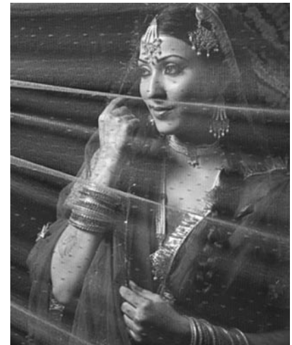
Mut'ah – Hôn nhân tạm thời

Trong tiếng Hindi, “devadasi” có nghĩa là “thánh nữ”. Một devadasi là người phụ nữ bị ép buộc bán dâm để phụng sự cho nữ thần sinh sản của đạo Hindu Yellamma. Khi các cô bé đến tuổi dậy thì, cha mẹ các bé sẽ bán đấu giá trinh tiết của họ.