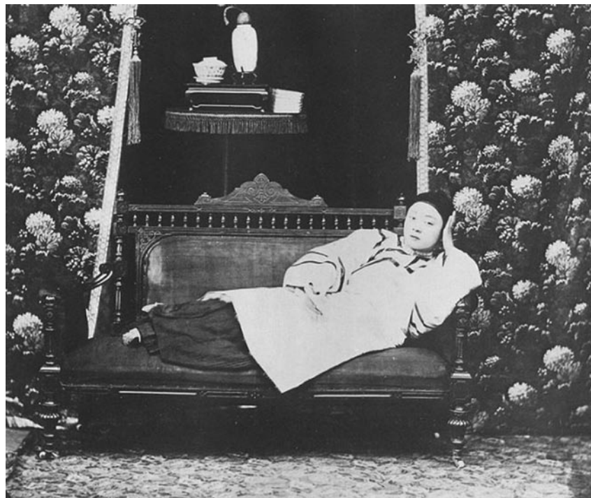
Ying-chi - Quân kỹ

Vai trò của mại dâm tôn giáo trong xã hội Hy Lạp – La Mã cổ đại vẫn là vấn đề gây tranh cãi. Người ta không tranh luận về tính phổ biến của hiện tượng này, mà chỉ thảo luận về cách hiểu khác nhau đối với chi tiết cụ thể trong đó. Mại dâm tôn giáo là những người bán dâm ngay trong các ngôi đền, miếu