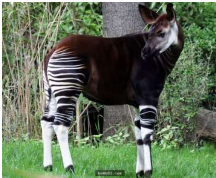
Hươu đười vượn thuộc dòng hươu cổ không cao lắm và có đôi nét giống ngựa vằn.