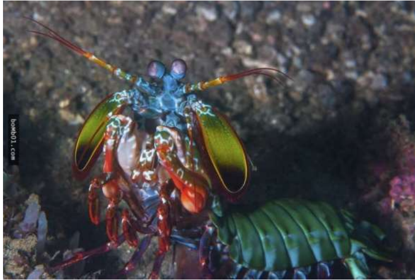
Tôm tít - loài tôm giống như vừa bước ra từ bộ phim "Nàng tiên cá"